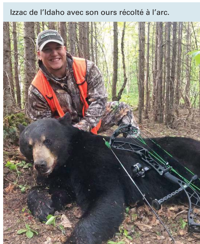
Izzac de l'Idaho avec son ours récolté à l'arc.