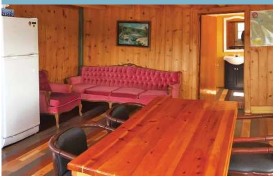
Chalet #7 : nouveau planché, nouvelle vanité de salle de bain.