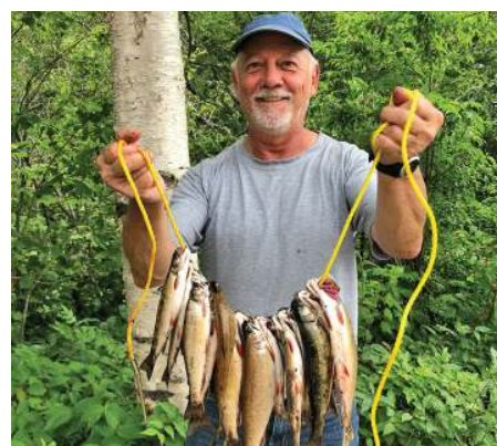
Un beau matin de pêche!

Participation au Salon National de la Pourvoirie de Québec Du 16 au 19 janvier 2020 Complexe Capital Hélicoptère Au plaisir de vous y voir!