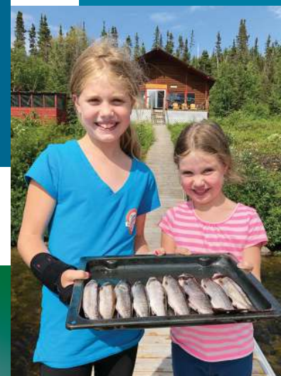
Deux fidèles clientes depuis leur naissance