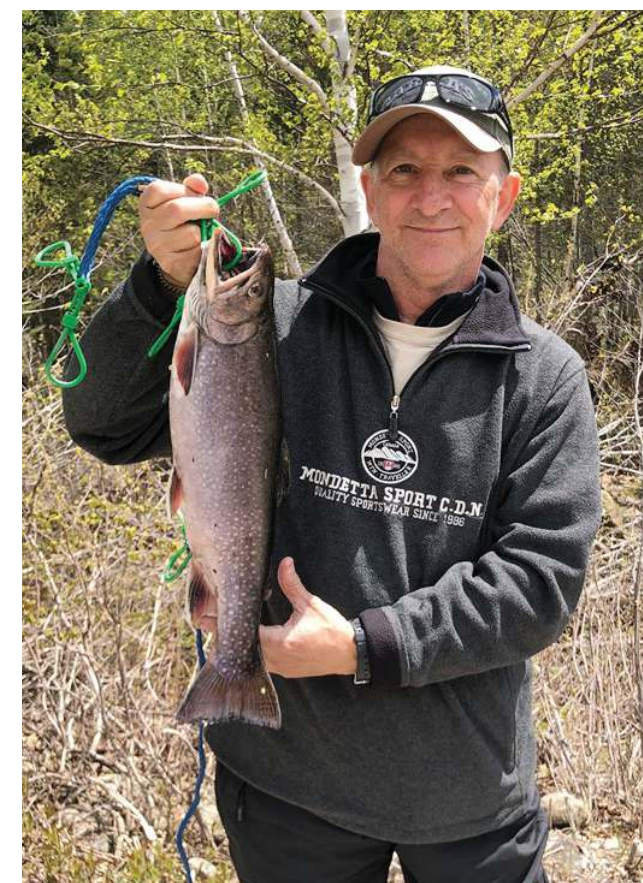
Superbe truite mouchetée de 19 ¼" pêchée début juin

Cet été, la nourriture était en abondance dans tous nos lacs, et ce, tout au long de la saison. Le niveau des lacs anormalement élevé et les nombreuses éclosions d'insectes en sont la cause. Il fallait donc user de patience et de stratégie pour sortir les truites de l'eau. Eh bien, malgré cela vous avez réussi à capturer plus de 12 800 truites. Bravo à tous nos pêcheurs ! Vous contribuez à notre succès année après année.