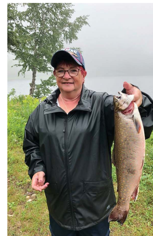
Belle truite de 18 ½" capturée début août