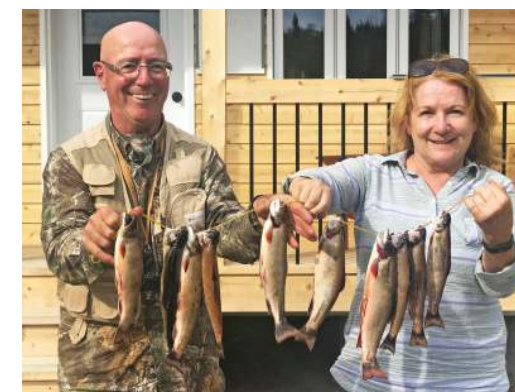
Une très belle pêche au lac Jumeaux